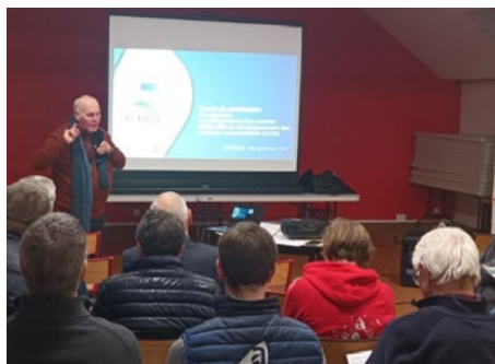
Lancement de l'EPE, 27 novembre 2023 à Recques-sur-Hem

CCRt : un dispositif d'accompagnement technique et financier pour vous accompagner dans vos projets de production de chaleur renouvelable.