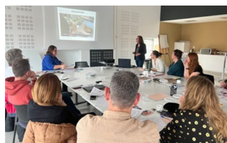
29/01 : 1er atelier Gourmet bag durable